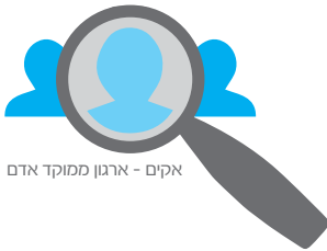
אקים - ארגון ממוקד אדם

בהתאם לחזונו מקדם הארגון הטמעת עמדות חיוביות כלפי אנשים עם מוגבלות שכלית. ומבצע זאת באמצעות מטה אקים, ובאמצעות 64 סניפים ומוקדי פעילות הפרוסים ב-82 ישובים ברחבי הארץ במגזר היהודי ובמגזר הערבי, שאותם מנהלים הורים ומתנדבים.